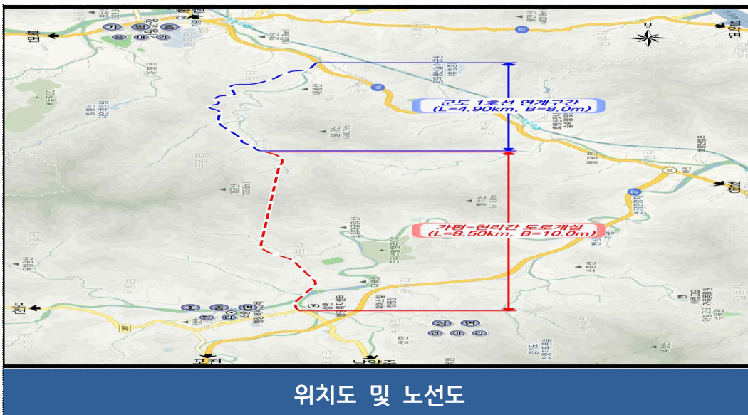
위치도 및 노선도