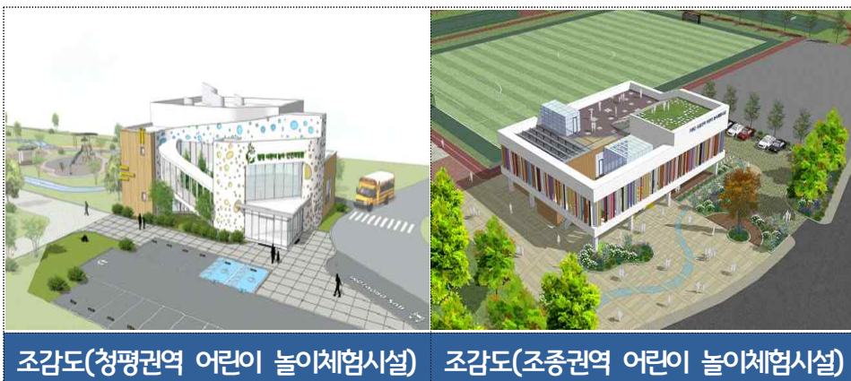
조감도(청평권역 어린이 놀이체험시설)