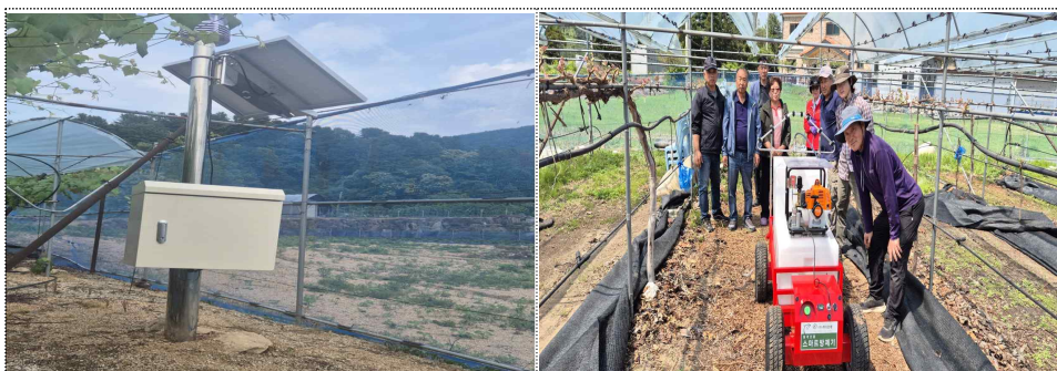
데이터 기반 생산모델 보급 시범