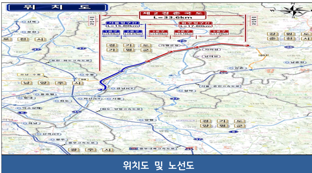
위치도 및 노선도