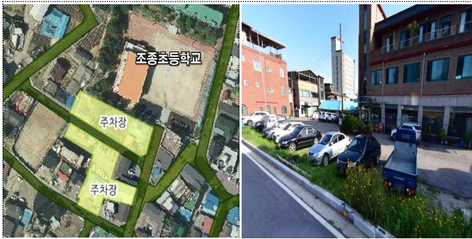
조종면 시가지(조종초교 앞)