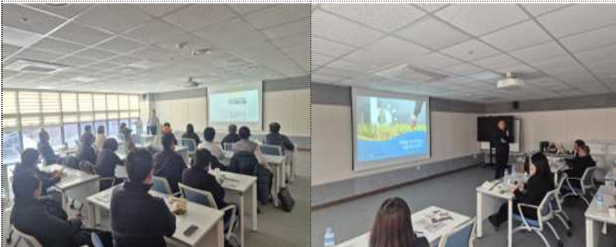
과실류 수출시장 이론 교육 및 2차 가공품 생산·수출 전략 교육